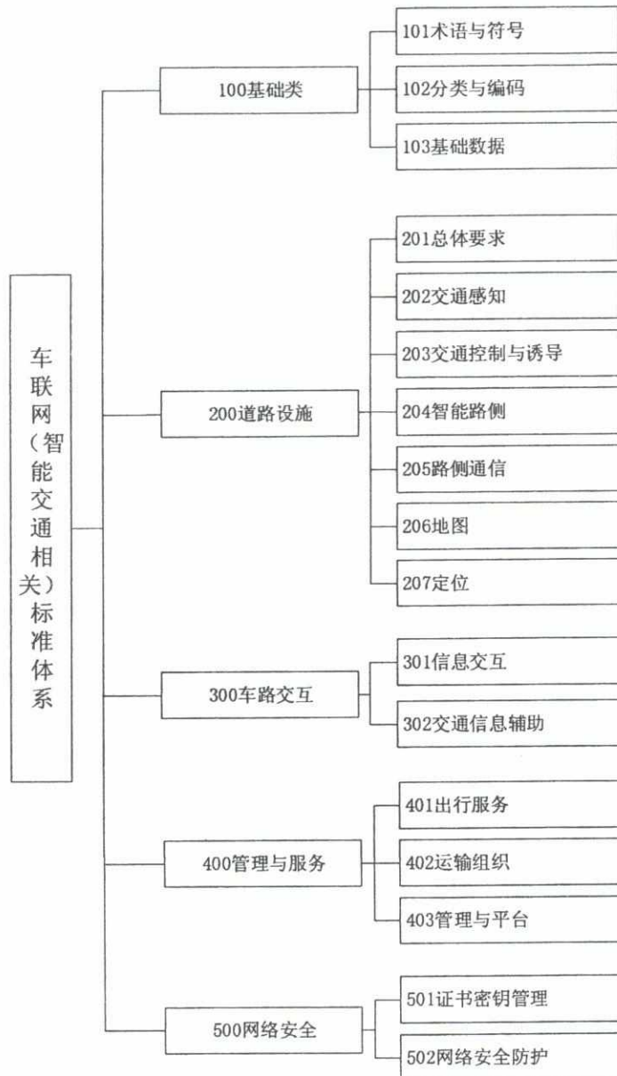
图 3 车联网（智能交通相关）标准体系结构图

准、道路设施标准、车路交互标准、管理与服务标准、网络安全标准等 5 部分。标准体系结构图见图 3。